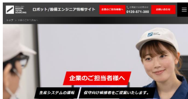
保全事業部のサービスサイトトップページ

当社は今後も、同サイトを通じてサービスをご利用いただく上で役立つ様々な情報を共有してまいります。