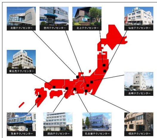
同サイトでは、当社テクノセンターの概要なども紹介